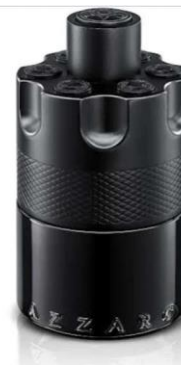
Azzaro The Most Wanted Eau de Parfum Intense 100 ml