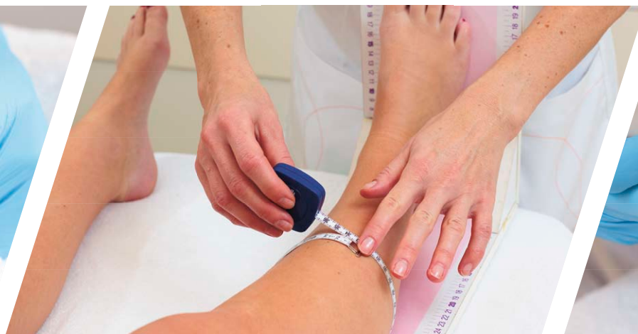
Oedeem of spataderen kunnen wij ook behandelen.