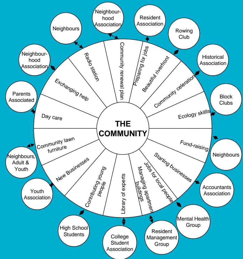
Local Associations and their Community Building Work