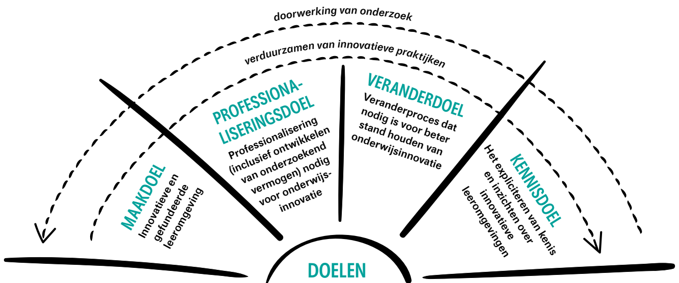
Figuur 2: Viervoudige fundering onder onderwijsinnovatie (Munneke & Zitter, 2019)