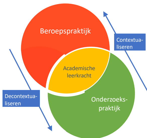
Figuur 1. Overbruggen van onderzoek naar beroepspraktijk en andersom

Academisch geschoolde leerkrachten worden opgeleid om een vertaling van onderzoek naar de lespraktijk te maken (zie gele gebied in Figuur 1).