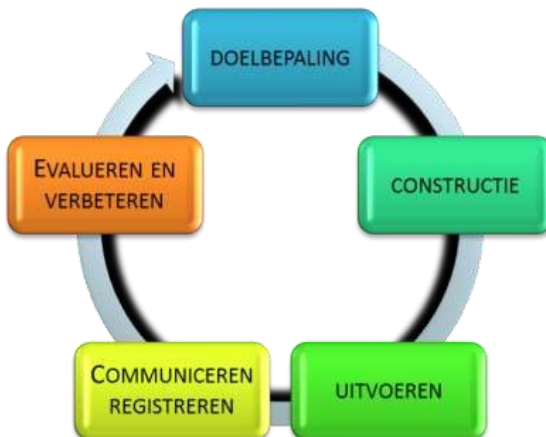
Figuur 2.1. Toetscyclus, aangepaste versie HU (t.o.v. Vereniging Hogescholen, 2013)

In 2020 zijn de leeruitkomsten landelijk herijkt. Dat betekent dat in de loop van het studiejaar ook de leeruitkomsten van de BKE op de HU worden aangescherpt en we met een nieuw formulier gaan werken. Trajecten die starten voor 1 januari 2021 kun je nog afronden met de 'oude', hierboven genoemde leeruitkomsten en bijbehorende criteria.