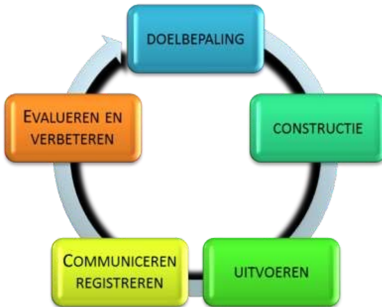
Figuur 4.3 Toetscyclus, aangepaste versie HU (t.o.v. Vereniging Hogescholen, 2013)

Op basis van de toetscyclus zijn de bekwaamheidseisen en indicatoren voor het HU certificeringstraject BKE gespecificeerd. Hierin wordt ook zichtbaar wat je doet in de verschillende stappen van de toetscyclus.